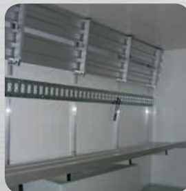
Etagères aluminium relevables (en option)