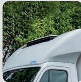
Déflecteur aérodynamique avec découpe tridimensionnelle pour groupe (en option)