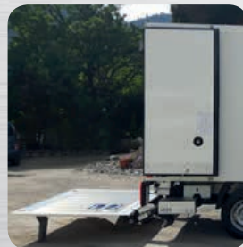
Hayon élévateur (en option)