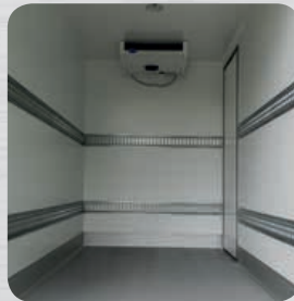
Niveaux de rails d'arrimage (en option)