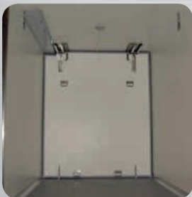
Cloison mobile relevable (en option)