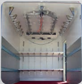
Réseau aérien Barres à viandes Protection aluminium (en option)