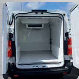
Plancher antidérapant avec passage de roues