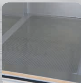
Plancher renforcé aluminium (en option)