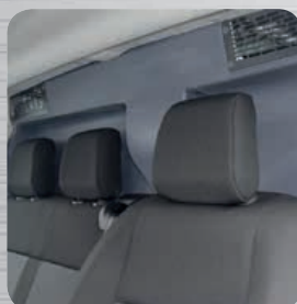
Quives de décompression obligatoires et conformes aux exigences constructeurs