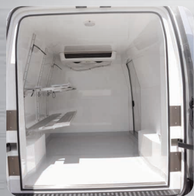
Etagères fixes ou relevables en option