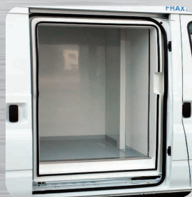
Isolation de la porte latérale coulissante