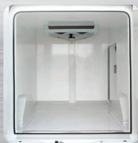
Plancher antidérapant avec passage de roues