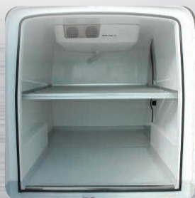
Option plancher intermédiaire