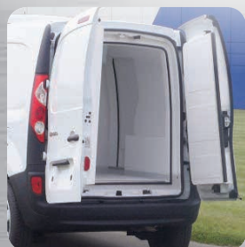
Isolation des ouvrants d'origine par des contre-portes isothermes

Étagères aluminium anodisé / Rails et sangles d'arrimage / Plancher intermédiaire / Barres à viandes / Seuil poissonnier / Rideau à lanières / Attelage de remorque / Ouverture(s) latérale(s)