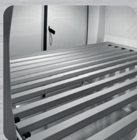
Plancher intermédiaire amovible à clayettes (en option)