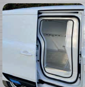
Accès porte latérale coulissante droite préservé