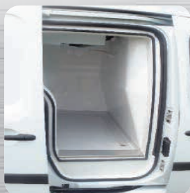
Porte latérale coulissante droite isolée en option