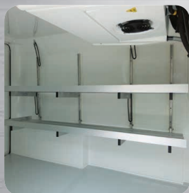
Plancher antidérapant avec passage de roues et étagères relevables