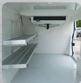
Nombreuses options personnalisées