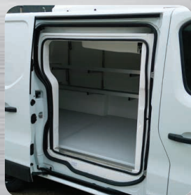
Contre-porte isotherme fixée sur la porte latérale d'origine