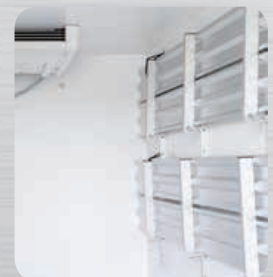
Etagères aluminium relevables