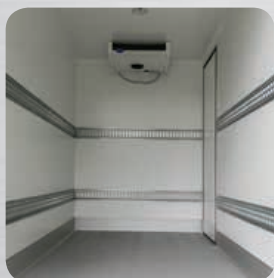
Niveaux de rails d'arrimage