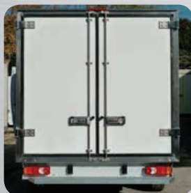
Cadre arrière 2 vantaux ouverture totale