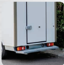
Marchepied pare-chocs arrière