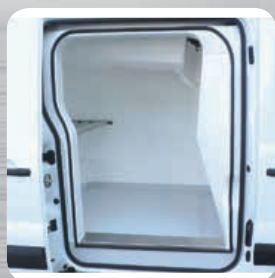
Contre-porte isotherme fixée sur la porte latérale d'origine