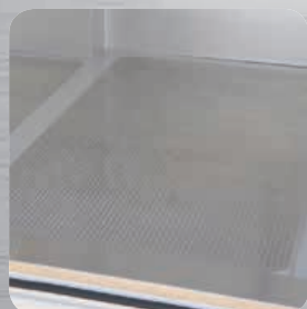
Plancher renforcé aluminium en option.