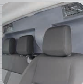
Quies de décompression obligatoires et conforme aux exigences constructeurs.