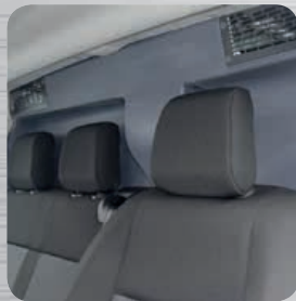
Quies de décompression obligatoires et conformes aux exigences constructeurs